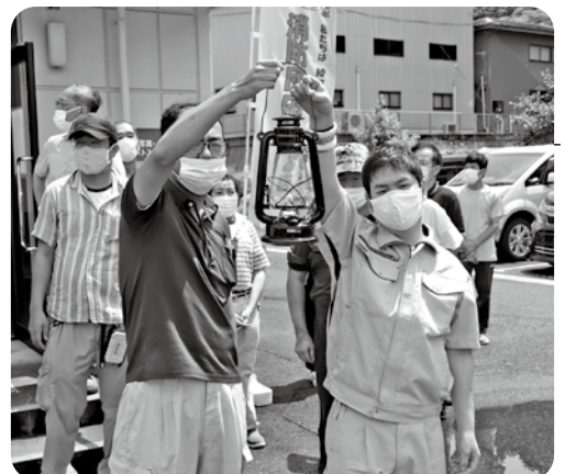
利用者代表の2人がランタンに火を灯し高く掲げました。

7月13日(火)、東京パラリンピック2020綾部採火イベントで使用される映像の撮影が、いかるがの郷で行われました。採火イベントは、8月15日(日)にあやべ・日東精工アリーナで行われる予定です（一般の方の観覧はできません）。