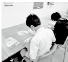
小口からまとまった量まで承ります

チラシの折加工・文書のセッティング ・封筒への封入・封かん・検品作業 ※出張しての作業も可能です