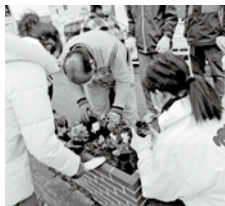
職員と利用者で出張します

フラワーポット(花壇)の植替作業・保 守作業・ふるさと産品の箱詰め作業。 民間企業からは庭そうじ、配達・剪定枝 かたづけなどの実績があります