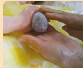
小さな手でころころと、羊毛玉から生まれる素敵なアクセサリー。