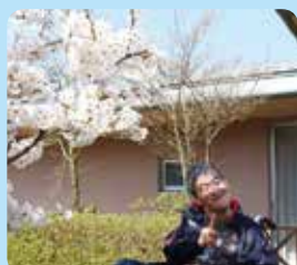
施設内は「桜、紅葉、雪景色」など自然美しい風景が感じられます。