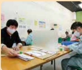
お札づくり。コロナ対策を取りながら、細かい作業に集中。