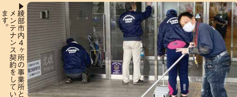
綾部市内4ヶ所の事業所とメンテナンス契約をしています。

ともの家には33名の方が在籍されています。現在は、主にお弁当事業とメンテナンス事業を行っていますが、移転後は手作りピザが自慢のカフェを併設しますので、皆様のご来店をお待ちしております。