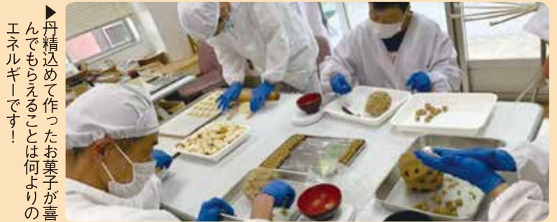
丹精込めて作ったお菓子が喜んでもらえることは何よりのエネルギーです！

あやべ作業所には現在69名が通所され、お菓子や醤油、縫製品等の仕事をしています。自宅で製品作りや訓練をする「出張作業所」を利用している方もあります。皆さんのお声に励まされ頑張っています。