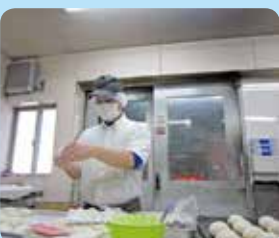
薪窯で天然酵母パンの製造販売を頑張っています！