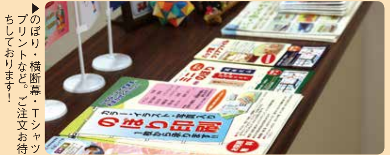
のぼり・横断幕・Tシャツプリントなど。ご注文お待ちしております！

いかるがの郷は障害のある人たちの就労支援をしています。一般の会社に就職する一般就労といかるがの郷で作業する人たちを支援しています。平成21年4月に開設し、現在58名の利用者が在籍しています。