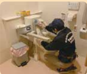
「いつもありがとう」の声を励みに心を込めて丁寧に作業しています。