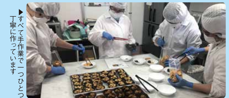
すべて手作業で一つひとつ丁寧に作っています。

サクラティエには現在22名が通所され、製菓やカフェの仕事をしています。自分たちの仕事に誇りを持って頑張っています。