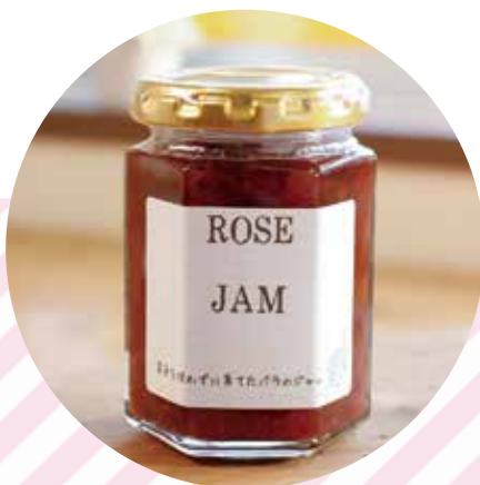
バラジャム…800円 (90g) 1,200円 (150g)