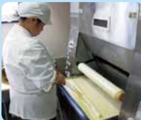
黙々と真剣にバームを焼いている姿です。