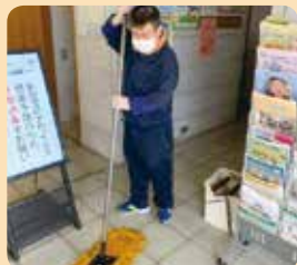
大きなモップもなんのその。口ずさみながら頑張ります。