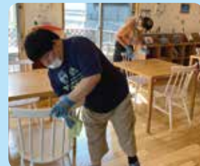
掃除や消毒などコロナ対策を徹底してお客様をお待ちしています。