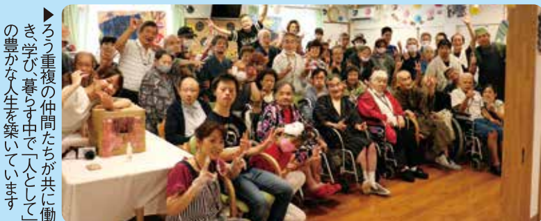
ろう重複の仲間たちが共に働き、学び、暮らす中で一人としての豊かな人生を築いています。

いこいの村栗の木寮は聴こえない障害とほかの障害を有する「ろう重複障害者」の労働・生活施設として昭和57年に開所しました。現在33名が施設入所、4名がグループホーム利用、8名が通所利用されています。