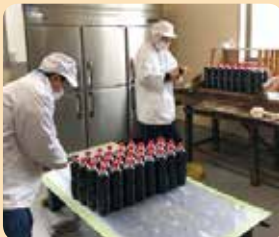
昭和の時代に誕生したダングンのお醤油。その味を受け継いでいます。